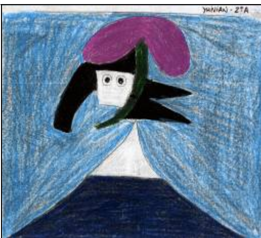
"CABEZA DE MUJER CON SOMBRERO" (1935)

En este cuadro Picasso muestra una gran habilidad artística y representar las emociones mediante formas sencillas y geométricas.