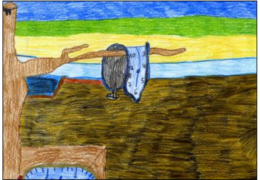
LA PERSISTENCIA DE LA MEMORIA

En esta época Dalí pintaba relojes blandos pues para él no existía el tiempo. Era su etapa surrealista.