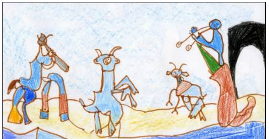
"LA ALEGRÍA DE VIVIR" 1946

A mí me gusta este cuadro porque representa la felicidad, el optimismo, la buena vida y las ganas de no desperdiciarla.