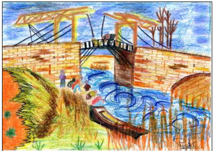
EL PUENTE DE ARLES

En este cuadro, pintado bajo el sol radiante del sur de Francia, Van Gogh utiliza los colores puros y crea un nuevo estilo alejado de las limitaciones de la pintura tradicional.