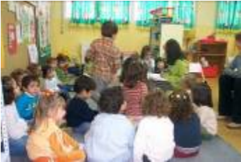
Los mayores leen a los peques