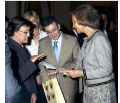
La reina se interesó por la biblioteca escolar