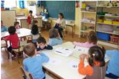
"Grandes maestros de lectura"