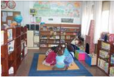
La biblioteca, lugar de encuentro