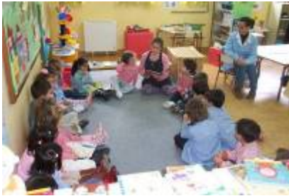
Los mayores leen a los peques