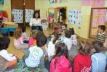
"Grandes maestros de lectura"