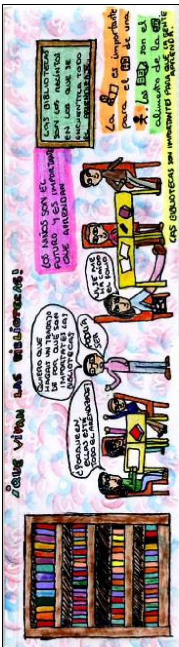
marcapáginas de Cielo, 6ºB